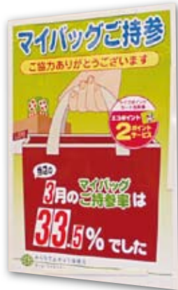
マイバッグ持参率推移