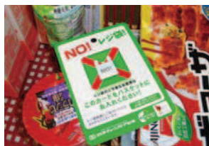
ノーレジ袋カード

ラップやトレーは、食品の安全や衛生管理において必要なものですが、ばら売りや簡易包装などにより、積極的に削減を進めています。また、使用するトレーは、強度を保ちながら重量を減らすことにより、資源の節約に努めています。