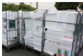
店舗から出た発泡スチロール

鮮魚や果物の一部は産地から発泡スチロールに詰められて入荷します。この発泡スチロールを集め、粉碎・減容後、板状に加工し、資源化しています。