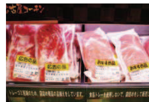
トレー不使用精肉