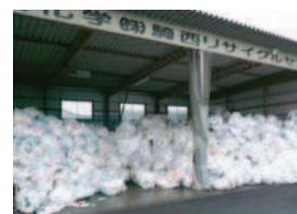
トレーリサイクルセンター

食品トレーは回収後、主に木くず・古紙と混合した高カロリー固形燃料(RPF)として利用されています。また、新しいトレーに生まれ変わるものもあります。