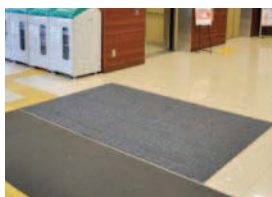
リサイクルマット

回収されたペットボトルは細かく粉碎・洗浄され、卵パックの原料になるほか、繊維に加工された後、マットや衣料品等にリサイクルされています。