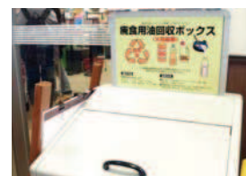
廃食用油回収ボックス

19店舗(2016年10月末現在)の店頭でお客様から使用済みのてんぷら油を回収しています。回収業者に精製を依頼し、液体せっけんにして店舗で使用しています。