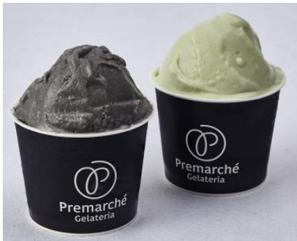
“Premarché Gelateria (プレマルシェ・ジェラテリア)” 『ジェラート』

合成乳化剤・合成安定剤を一切使用しないジェラート。グルテンを含有する素材も使用していないので、安心してお召し上がりいただけます。ビオラルカフェにて販売いたします。