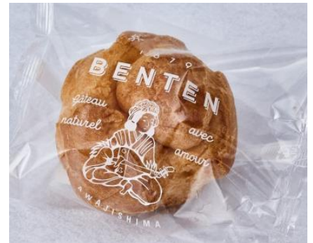
“弁天堂”『シュークリーム』

「お米から新しい食を提案したい」と米粉を使用したグルテンフリーなスイーツを提供するお店“チーノ”。シフォンケーキは米粉のもっちり感とシフォンのふんわり感が楽しめる人気商品。