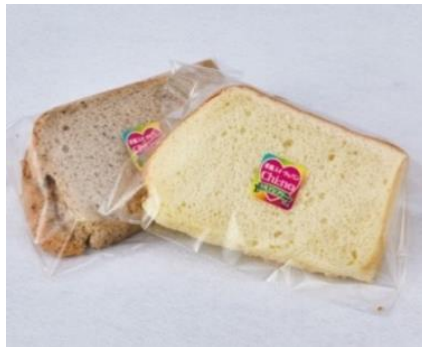
“Chi: no (チーノ)”『シフォンケーキ』

合成乳化剤・合成安定剤を一切使用しないジェラート。グルテンを含有する素材も使用していないので、安心してお召し上がりいただけます。ビオラルカフェにて販売いたします。