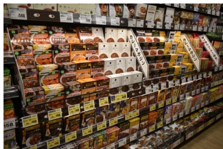
【食品】 レトルトカレー