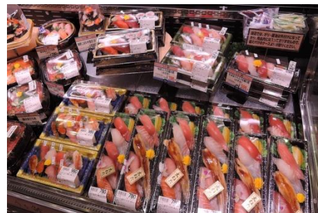
【水産】 うを鮨 こだわりの生ネタで作るにぎり寿司や巻き寿司を品ぞろえいたします。大ネタ握りは食べ応え抜群です。