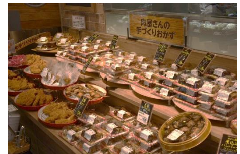
【畜産】 お肉屋さんの手づくりおかず 串カツやメンチカツなどの揚げ物や、ハンバーグ・肉団子などのメインのおかずにも最適なこだわりのおかずを展開いたします。