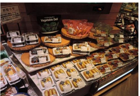
【惣菜】 ベジタブルデリ、健康系弁当

「オーガニック」・「ローカル」・「ヘルシー」がコンセプトのプライベートブランド「BIO-RAL (ビオラル)」の商品を展開いたします。