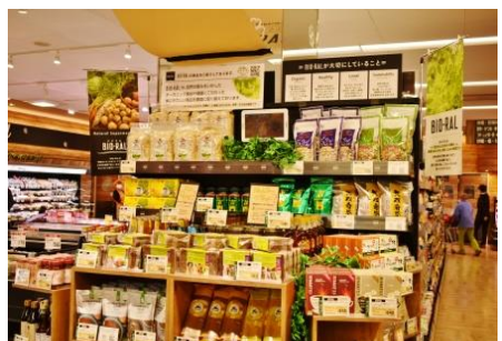
【食品】 ビオラルコーナー

ナチュラルチーズは原産地で仕入れ、店内でカットしています。その場で作るピーナッツバターも大人気商品です。