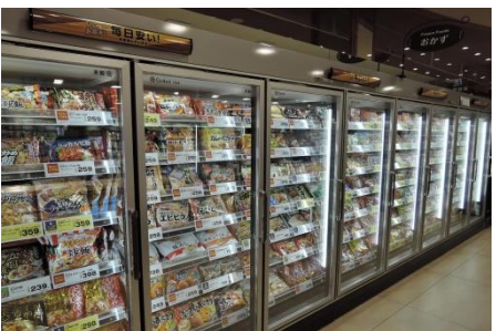
【食品】 冷凍食品コーナー