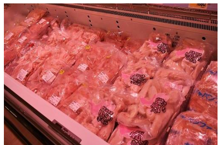
【畜産】 冷凍お肉コーナー