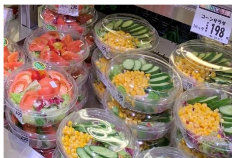
【農産】 カットサラダ 新鮮な野菜を店内でカットしたフレッシュなカットサラダを品ぞろえいたします。