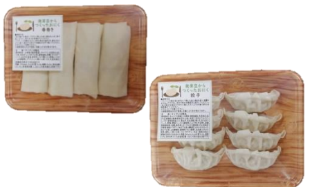
【畜産】 ミライのおにぎ

発芽させることで栄養をより引き出した大豆を原料とした植物肉です。餃子などの調理加工品を品ぞろえいたします。