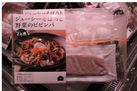
【農産】 ミールキット

食材・調味料・レシピ付きで、短時間で調理できるミールキットを品ぞろえいたします。