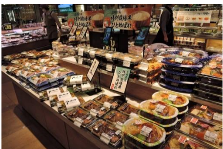
【惣菜】 豊富なお弁当、鉄板焼きコーナー 店内炊飯で作るお弁当や、鉄板を使用して作る玉子焼き・お好み焼き・チャーハンなどを出来立てでご提供いたします。