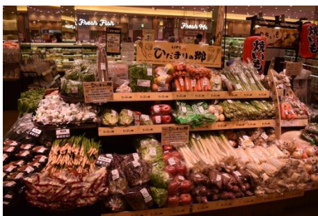
【農産】 ひだまりの郷 神奈川県産の野菜を中心とした、色鮮やかな野菜や果物を展開いたします。

近郊で採れた農・水産物、出来立ての惣菜や店内加工のフレッシュなサンドなどを取りそろえます。 ※写真はすべてイメージです