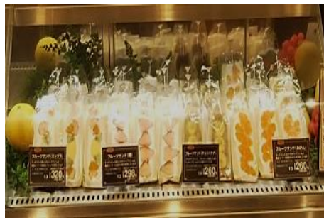
【小麦の郷】 サンドイッチコーナー 農産売り場で販売しているフレッシュなフルーツを使用したフルーツサンドや、ボリューム満点のかつサンドなどを豊富に取りそろえいたします。