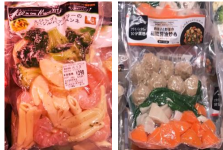
【水産・畜産】 冷凍ミールキット