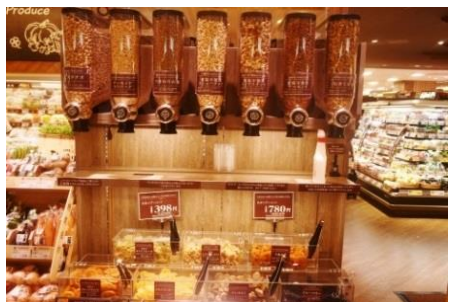
【農産】 ドライフルーツ&ナッツバイキング