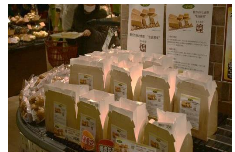
【小麦の郷】 焼きたてパンの数々 ホテルブレッド・やさしい甘さが特徴の「煌(きらめき)」などの食パンやフランスパンなど朝食にもぴったりな商品を品ぞろえいたします。