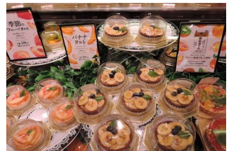
【農産】 くだもの屋さんのフルーツタルト 店内で加工したみずみずしい果物をフルーツタルトにご提供いたします。