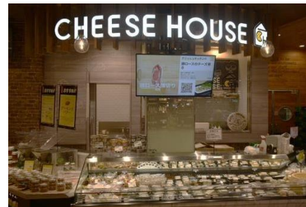
【食品】 チーズハウス

発芽させることで栄養をより引き出した大豆を原料とした植物肉です。餃子などの調理加工品を品ぞろえいたします。