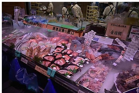
【水産】 対面調理コーナー 鮮度抜群な生魚を取りそろえ、お客様のご要望に合わせて調理いたします。