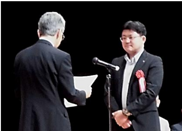
6月26日 大阪府立男女共同参画・青少年センターでの贈呈式

株式会社ライフコーポレーション（以下、当社）は、「一般社団法人おおさか人材雇用開発人権センター」が主催する、平成29年度における障がい者雇用に関する評価・顕彰にて取り組み内容を高く評価いただき、「就職マッチング賞」「人材開発・養成貢献賞」の2つの賞を同時に受賞いたしました。