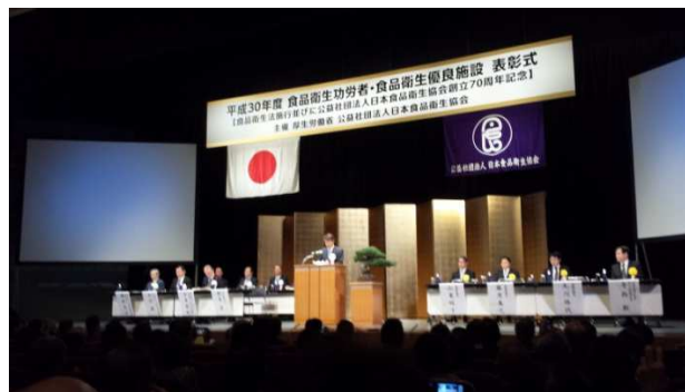
10月25日 明治座（東京都中央区）での表彰式

この表彰は、公益社団法人日本食品衛生協会が、食品衛生の一層の向上を図り、国民の食生活の安全と健康の増進に寄与することを目的に、食品衛生における功績があり他の模範となる優良施設の表彰を行っているもので、今回で63回目となります。