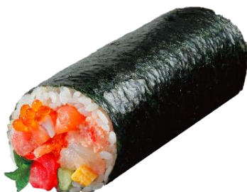
首都圏予約限定 【大間産】本鮪入り海鮮太巻

※1 ライフのカード会員様限定で、ご予約特典を実施。対象商品をご購入いただくとライフでご利用いただけるポイントをプレゼント