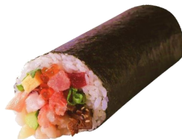
近畿圏予約限定 いくらと本ずわいが入 ご馳走海鮮太巻