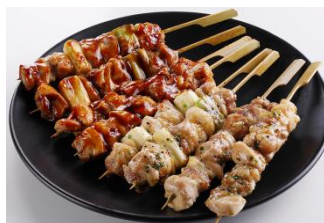
鹿児島県産やきとり各種