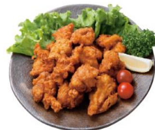
あご入りだしの旨み！若鶏手揉み唐揚げ