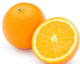
マイクおじさんのネーブルオレンジ