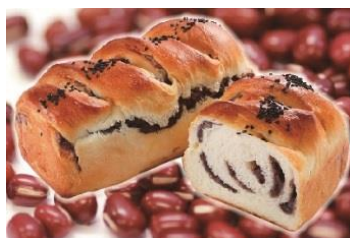
小麦の郷 あんぶれっど