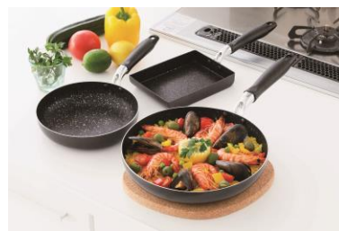
スマイルライフ フライパン各種 (ガス火用・IH用)