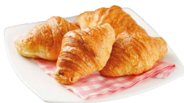
ミニクロワッサン