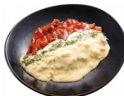
たまごタルタルのチキン南蛮