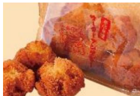
サクサクサターアングギー