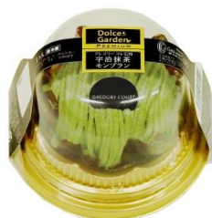
ドルチェガーデンプレミアム グレゴリーコレ監修 宇治抹茶モンブラン