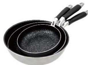
スマイルライフ ダイヤモンドマーブル加工フライパン