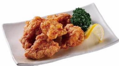
大分産豊後どり竜田揚げ (むね) 国産生姜使用