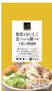
ライフプレミアム 野菜をおいしく食べられる鍋つゆ (十穀入醤油味・しお味)