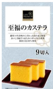
ライフプレミアム 至福のカステラ 9切入