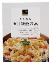
ライフプレミアム だし香る 五目釜飯の素200g