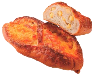
焦がれるチーズフランス