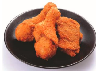
14 種スパイスのフライドチキン