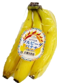
エクアドル産 ソルビーダバナナ