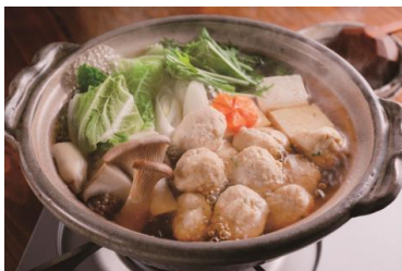
ライフオリジナル 九州産鶏肉使用なんこつ入り生つまみれ(ゆず味)