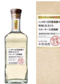
ニッカさつま司蒸留蔵が 特別に仕立てたスモーキーな麦焼酎