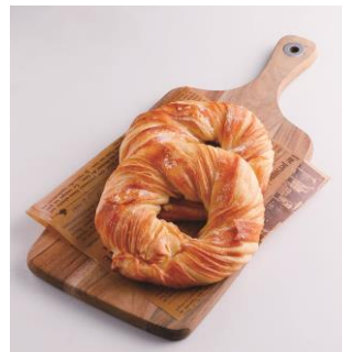
ベーグルクロワッサン