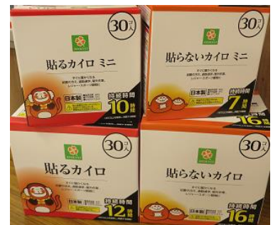
スマイルライフ カイロ