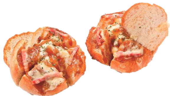
あめ色玉ねぎのチーズポテト