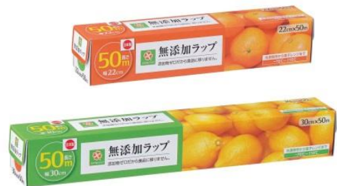
スマイルライフ 無添加ラップ