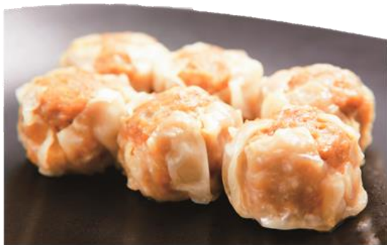
ジューシー肉焼売