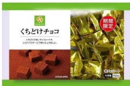
スマイルライフ くちどけチョコ