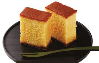
ライフプレミアム 長崎かすてら 10切入