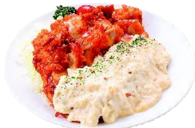
具沢山タルタルチキン南蛮