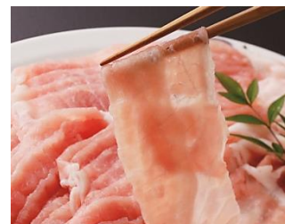
アメリカ産ロース豚肉 「極」うす切り ※4/6から発売