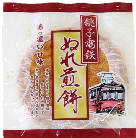
ぬれ煎餅 赤の濃い口味