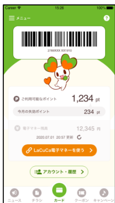
ポイントカード連携後 「LaCuCa 電子マネーを使う」 をタップ