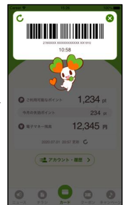
ワンタイムバーコードで 電子マネー決済