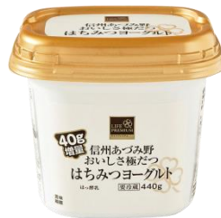
ライフプレミアム 信州あづみ野 おいしさ極だつ はちみつヨーグルト