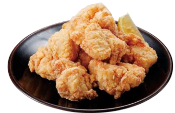
純和赤鶏むね塩唐揚げ