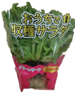
おうちで収穫サラダ