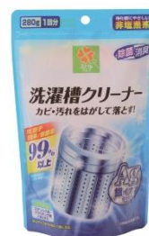
スマイルライフ 洗濯槽クリーナー