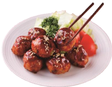
5種類野菜が入った自社製肉団子