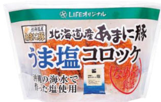
塩が決めて！ 北海道産あまに豚のうま塩コロック