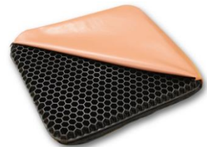
ジェルクッション