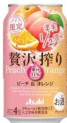
アサヒ贅沢搾り ピーチ&オレンジ