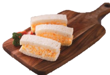
絶品！たまごサンド